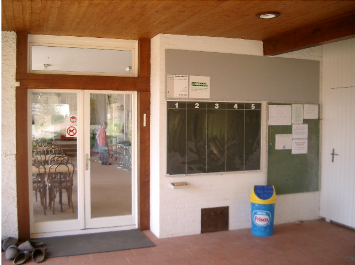
Clubeingang rechts / über schwarzer Tafel (Abb. 10)

Neben dem Clubeingang haben Sie die Möglichkeit, eine Alu-Tafel – mit Ihrem Firmenlogo bedruckt – aufzuhängen. Mit dieser Werbefläche können Sie ins Clubhaus eintretende Mitglieder und Gäste ansprechen.