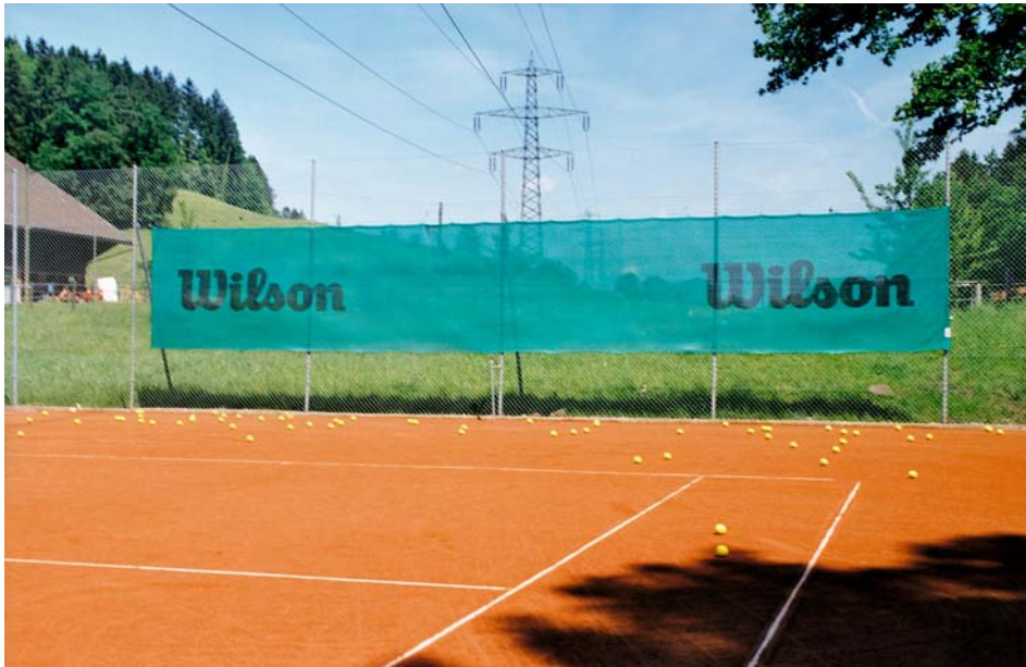
Abb. 1, Grösse 12 x 2 m

Ihr Firmenlogo mit oder ohne Ihrem Werbeslogan wird auf eine dunkelgrüne, spezielle Stofffläche gedruckt und anschliessend aufgehängt. Im Winter wird die Bande von uns im Clubhaus gelagert.