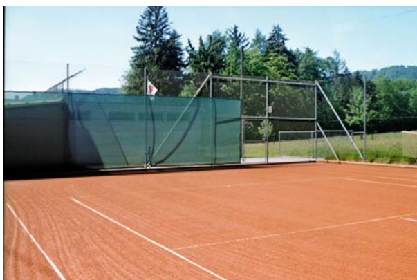
Platz 5, Südseite / Trainingswand