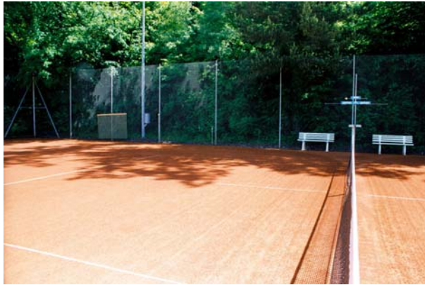
Platz 3, Strassenseite / Waldseite