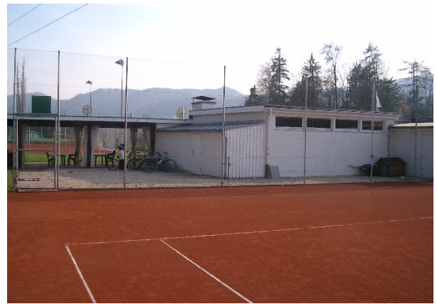
Platz 4, Südseite