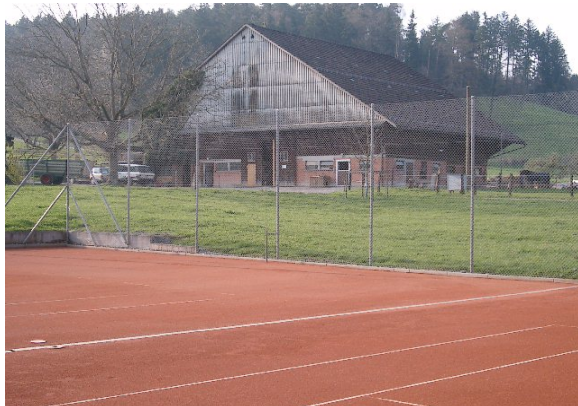
Platz 5, Nordseite